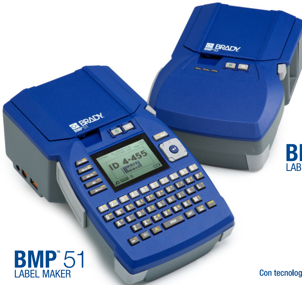
BMP™ 51 LABEL MAKER