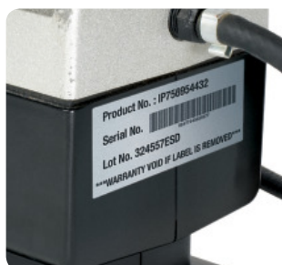
Etiquetas para placas de características