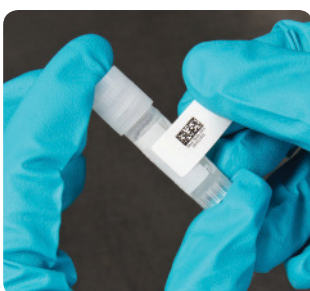
Etiquetas para tubos criogénicos