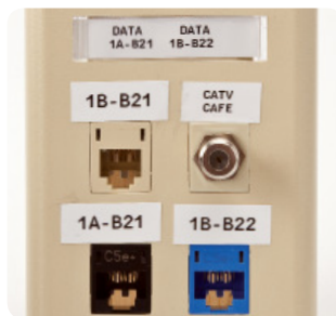
Etiquetas para placas frontales y tomas de corriente