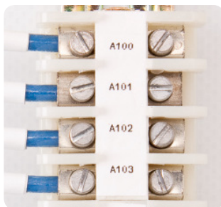
Marcadores de paneles de conexiones