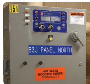
Etiquetas para paneles eléctricos y de control